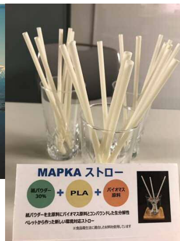
生分解性マップカストロー