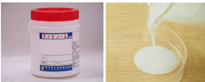
図1. CNF 含有アクリル系エマルジョン（左：外装，右：内容物）

CNF の添加量を調整することで、特性の異なるエマルジョンを製造することが可能となります（図2）。